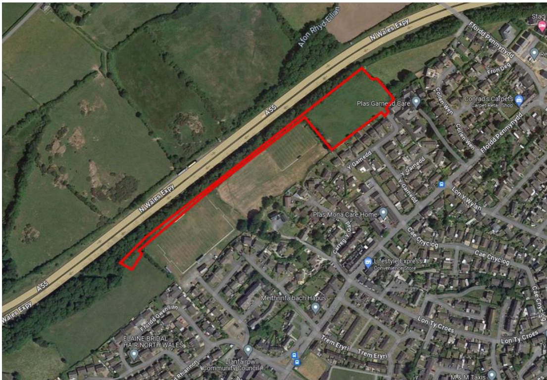
Ffigur 2.1 Delwedd o'r awyr sy'n nodi safle'r cais yng nghyd-destun yr hyn sydd o'i amgylch

2.3 Mae cae chwarae pêl-droed ieuencid ar dir i'r de-orllewin o safle'r cais ac mae tir yn uniongyrchol i'r dwyrain yn dir amaethyddol. Mae Cartref Gofal Plas Garnedd i'r de-ddwyrain o'r safle ac mae modd cael mynediad yno o Y Garnedd hefyd.